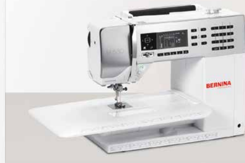
B 530 mit Anschlagetisch

Ob beim Nähen oder Quilten: Bei der BERNINA 530 und 570 QE ist die Verbindung von modernem Design und hoch entwickelter Technik selbstverständlich. Denn die BERNINA Ingenieure sind der Ansicht, Technik sollte nicht nur ihren Zweck erfüllen, sondern auch in Form und Design für einen kreativen Lifestyle stehen.